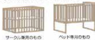
サークル兼用のもの ベッド専用のもの

②SGマークが表示されているベビーベッドの種類は、大別すると次の2つにわけられます。