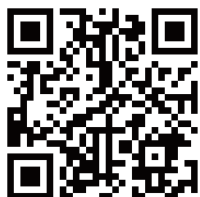
補足説明書はこちら (ベビー・ママ用/ペット用 共通)

本製品は空調ファン対応製品に共通して使用するファンユニットです。 取付方法・使用上の注意は、用途別の補足説明書をご確認ください。